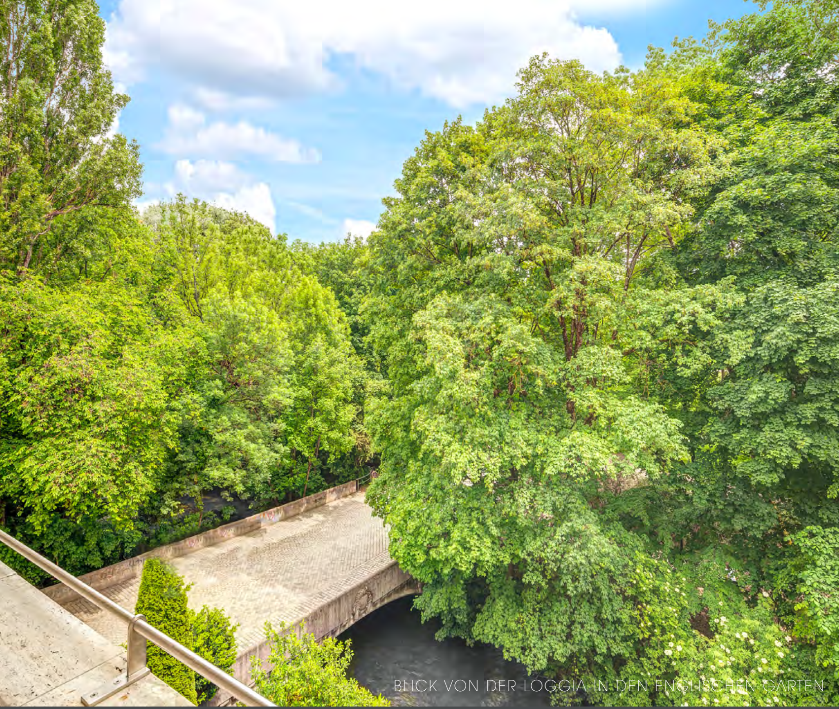
BLICK VON DER LOGGIA IN DEN ENGLISCHEN GARTEN